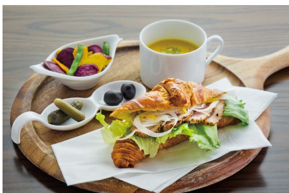
Croissant Sandwich Lunch Plate (Duck)