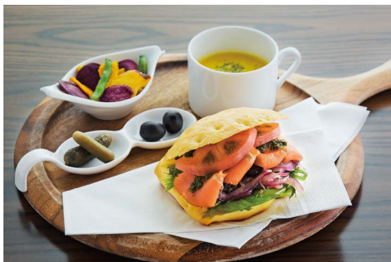
Focaccia Sandwich Lunch Plate (Salmon)