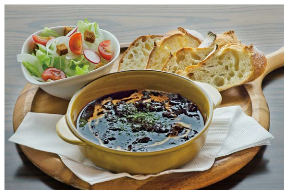
Beef Tendon Curry (with bread)