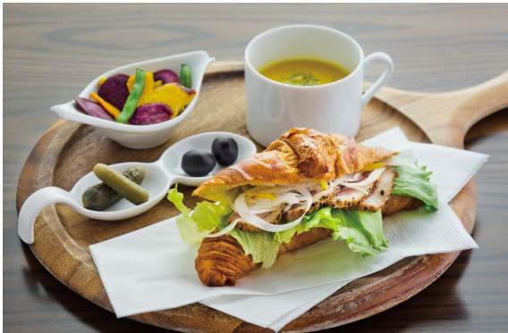
合鴨 クロワッサンサンド プレート (季節のスープ & チップス セット)

ピリッと黒胡椒の効いた合鴨をサンドして和風に仕上げています。 ドレッシングに加えた柚子のスライスが風味のアクセント。