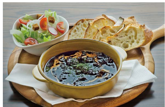
牛スジ肉のブラックビーフカレー (自家製パン & サラダ セット)