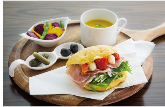
生ハム フォカッチャサンド プレート (季節のスープ & チップス セット)

生ハムと相性の良い濃厚なクリームチーズと、旨みが凝縮 されたドライトマトを入れた具沢山のサンドイッチです。