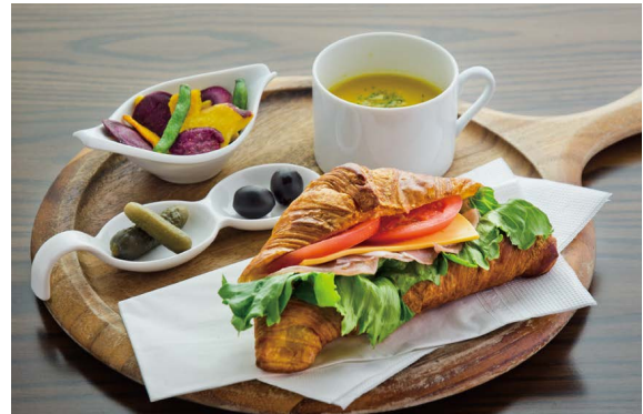
生ハム クロワッサンサンド プレート (季節のスープ & チップス セット)