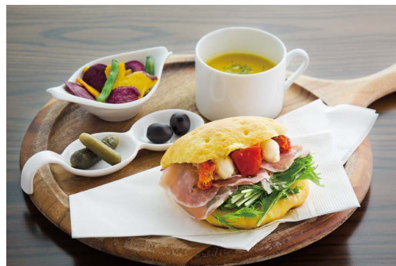
Focaccia Sandwich Lunch Plate (Cured Ham)