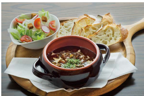
Beef Stew (with bread)