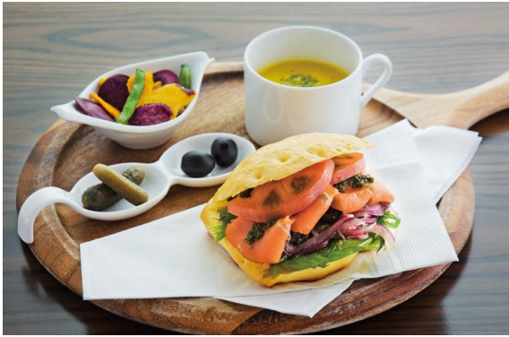
サーモン フォカッチャサンド プレート (季節のスープ & チップス セット)

スモークサーモンにマリネ野菜と黒オリーブを 合わせてジェノベーゼソースで仕上げました。