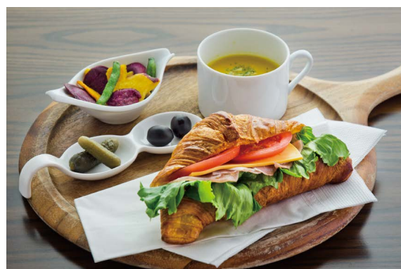
Croissant Sandwich Lunch Plate (Cured Ham)